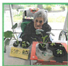
冬瓜と朝顔を植えました