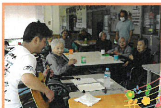
ギター演奏は楽しいひと時